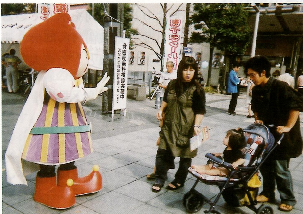
(昨年のキャンペーン状況)

◎静岡県結核予防婦人会各支部の協力を得て、県内各地において複十字シール募金運動、街頭キャンペーンを実施し、結核予防思想の普及啓発を図ります。