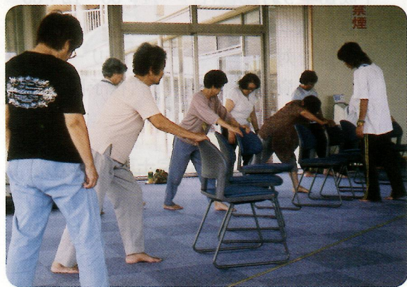
(転ばぬ先のちえ教室)