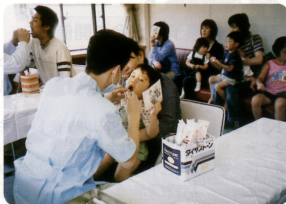
(歯の健康まつり 検診相談風景)

骨折や寝たきりの原因となる転倒を予防するため、60 歳以上の希望者を対象に「転ばぬ先のちえ教室」の実施や終了後の「フォロー教室」を開催し、定期的に運動する機会を作っております。