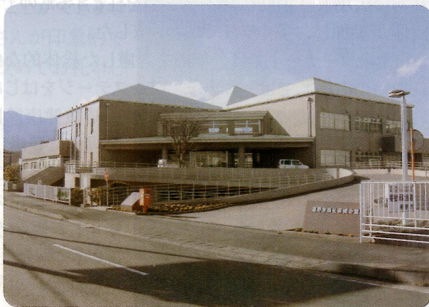
(裾野市福祉保健会館)