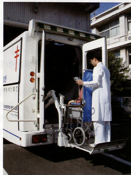
車椅子で検診車内へ