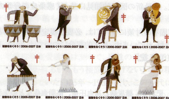
DOUBLE-BARRED CROSS SEALS 2006

どなたでも募金運動にご協力できます♪運動にご協力・資料請求をご希望される方は下記にご連絡ください。