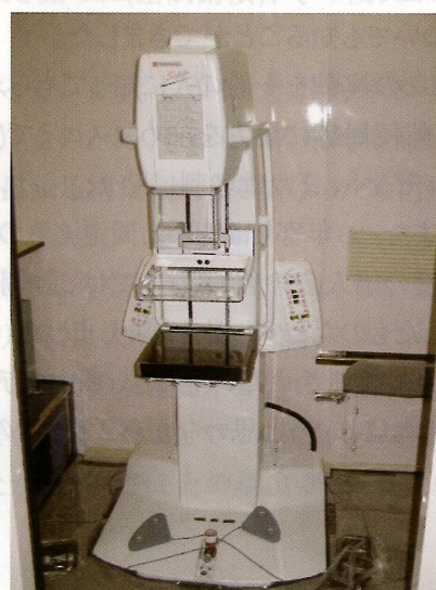
最新デジタルマンモグラフィ装置 (車内)