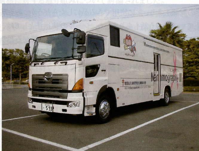
ピンク色をベースにピンクリボンを付けて県内を走ります！

こうしたことから、当会では、これまでの各種の検診事業で培った経験を生かして、18年4月から乳がん検診車（マンモグラフィ装置2基搭載）により県内の市町へ、写真のようにスマートな車両により住民検診や事業所検診に伺います。是非ご家族の安心・安全のため、検診にご利用ください。