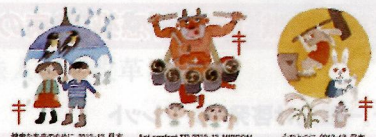
結核のない世界へ 2012-13 日本 Act against TB 2012-13 JAPAN 心のつな 2012-13 日本

◆ 複十字シール みんなの力で結核や肺がんをなくすために 複十字シールは世界共通の結核予防運動の旗印です