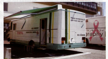
子宮頸がん検診と乳がん検診を同時に実施している風景です。