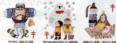
FC 2012-13 日本 TB Free World 2012-13 JAPAN 結核のない世界へ 2012-13 日本