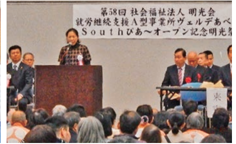
第58回明光祭 平成30年11月3日(土) ツインメッセ静岡