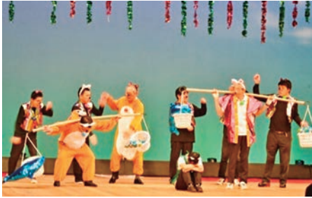
第59回文化祭 令和元年7月12日(金) 市民文化会館中ホール

明光会では 17 の事業を行っており、利用者は 7 歳～78 歳の利用者が福祉サービスを利用されています。日常の活動のほかに明光祭・文化祭・運動会など法人全体の行事や各事業所でのイベントや行事などを通して表現の場の提供や生活の楽しみを感じていただけるようにしています。