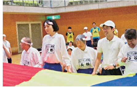
第58回運動会 平成30年9月15日(土) 北部体育館