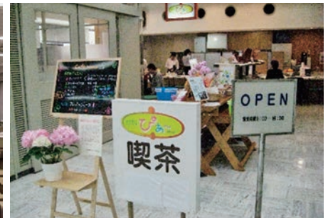
喫茶ぴあ～ 静岡県庁2階で営業中!