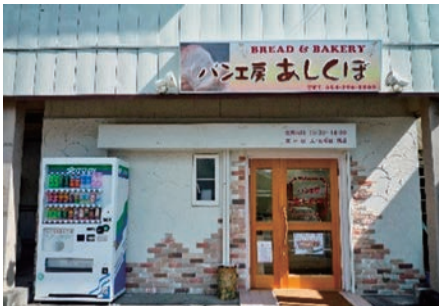
パン工房あしくぼ 足久保口組にて営業中

パン工房あしくぼの地域常設店、県庁 2 階の喫茶ぴあ～、総合庁舎地下 1 階の Southぴあ～を通して障害をお持ちの方の就労をサポートしています。誰でも気軽に入れるお店となっていますのでぜひお立ち寄りください！