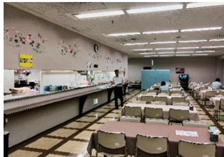
Southぴあ～ 平成30年4月9日(月) 総合庁舎(駿河区有明) open